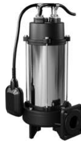
KRAKEN 1800 DF